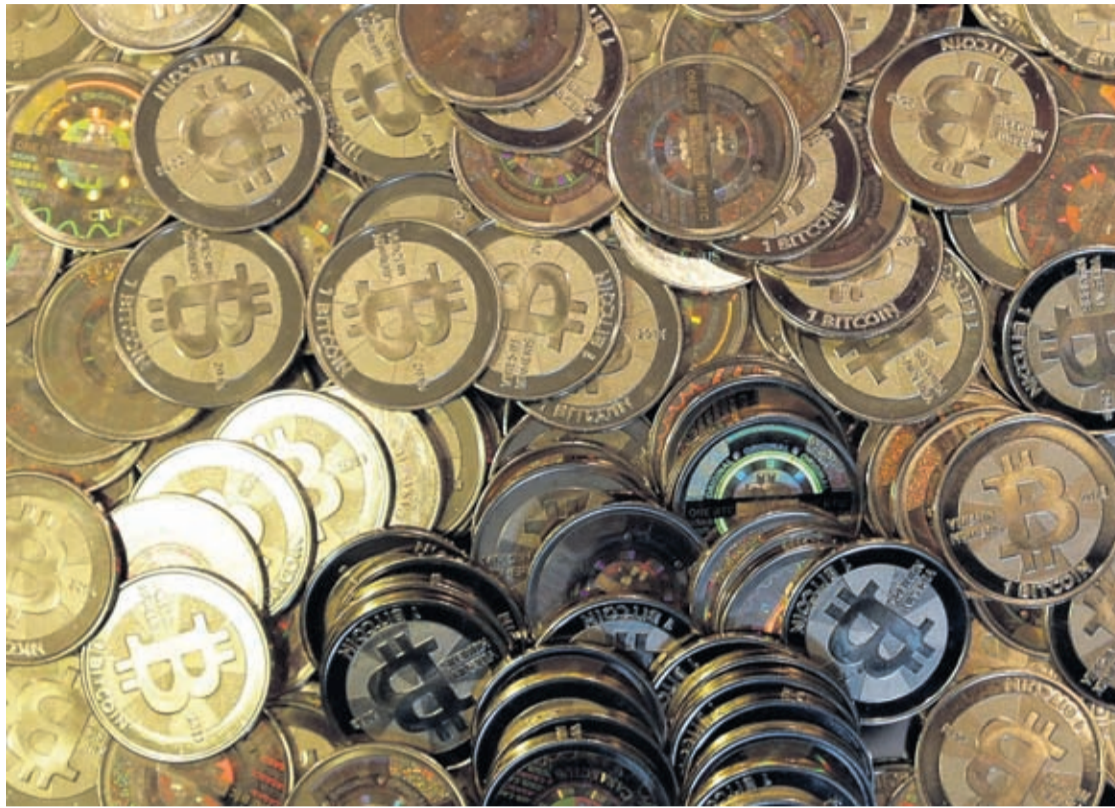
This April 3, 2013, file photo shows bitcoin tokens in Sandy, Utah.